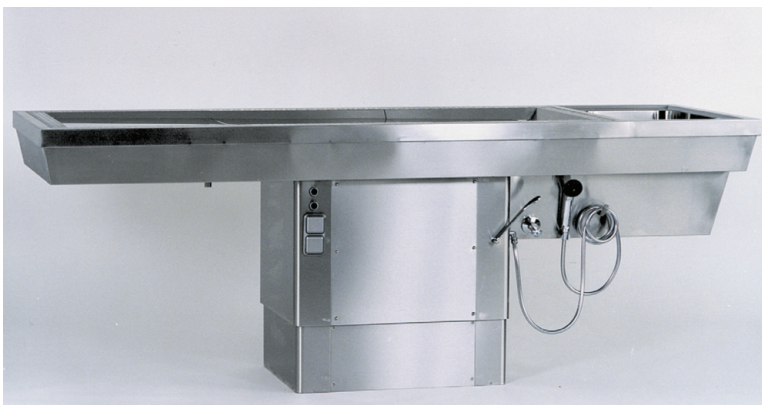
Seziertisch mit Luftabsaugung STV 10/850