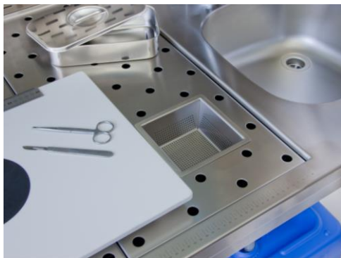
Zentimeter-Skala am Zuschneidetisch oder GrossPath eingesägt LIN-UCS Art. Nr. 060.012.076