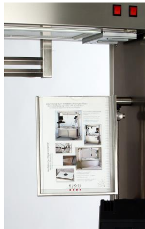
Schwenkbarer Dokumentenhalter seitlich am Stangensystem DH-A4-SS Art. Nr. 060.012.031