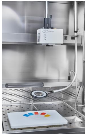
Lupenleuchte am Railingsystem LL-WM72-RS Art. Nr. 060.016.065