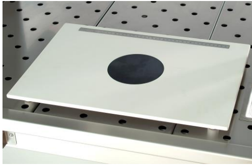
Schneidebrett aus Corian mit schwarzem runden Punkt SB-CO-50/40-SE Art. Nr. 060.012.012