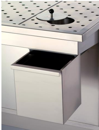
Müllabwurfschacht mit Absaugung und Edelstahlmülleimer MÜ-AS-150-M Art. Nr. 060.012.056