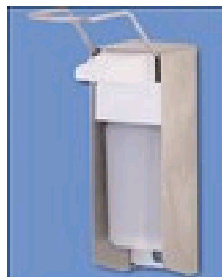
Wandspender für Desinfek- tionsmittel WS-DM-100 Art. Nr. 090.320.015