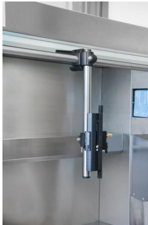
Kamerahalter am Railingsystem KA-H-400 Art. Nr. 060.015.085