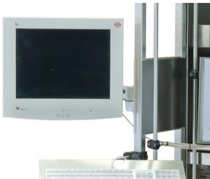
Monitorhalter MT-SS zur Befestigung am Stangensystem Art. Nr. 060.022.033