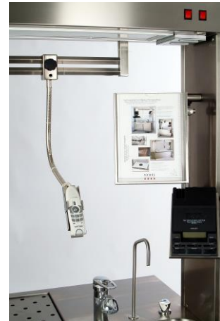
Flexibler Mikrofonhalter am Railingsystem FHH-RS-500 Art. Nr. 060.015.035