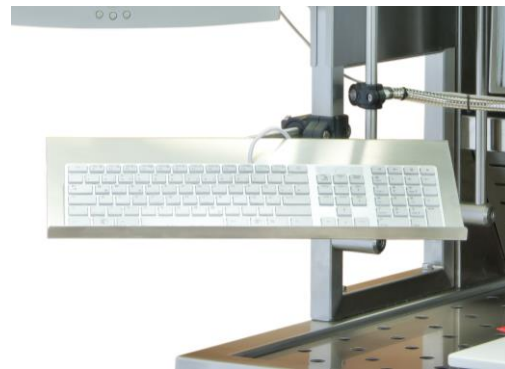
Schwenkbares Tastaturhalteblech passend für Stangensystem THB-SS Art. Nr. 060.022.080