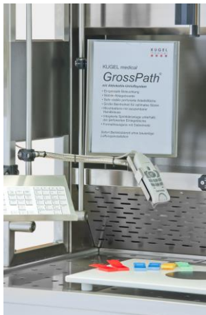
Flexibler Mikrofonhalter seitlich am Stangensystem FHH-SS-300 Art. Nr. 060.015.036