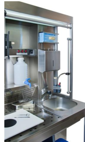
Handschuhkartonhalterung aus Edelstahl HHK-UCS-BEA Art. Nr. 060.020.070