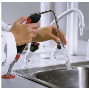
Formalinpistole mit Schlauch FPT-BR-200 Art. Nr. 060.012.170