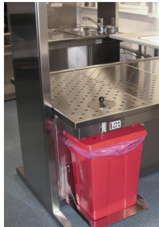
Müllabwurfschacht mit Absaugung für Kunststoffmülleimer MÜ-AS-150-M-K Art. Nr. 060.012.057