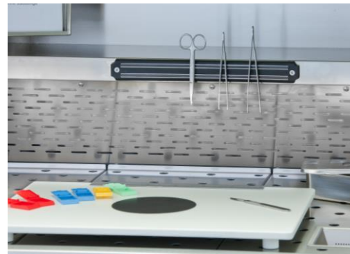
Magnetschiene für Instrumente am Ablageboard montiert MS-300 Art. Nr. 060.012.077