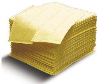
Absorbentmatten zur Aufnahme von Flüssigkeiten ABS-M-200 Art. Nr. 090.020.600