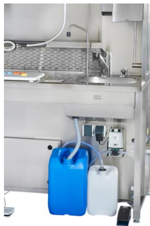
Formalin-Dispensing System FDS-05/1-F Art. Nr. 060.012.024