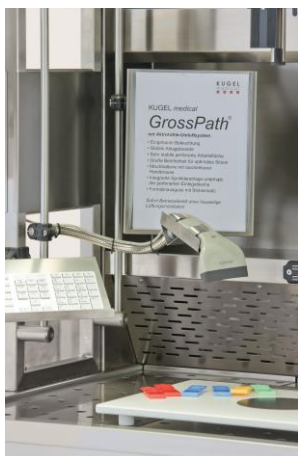
Schwenkbarer Scannerhalter seitlich am Stangensystem FH-SCAN-SS-300 Art. Nr. 060.100.105