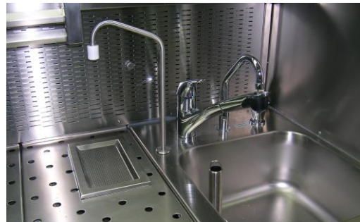
Formalinhahn mit Kugelhahn FZH-15-K Art. Nr. 060.012.016