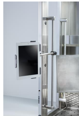
Flexibler iPad/Tablet Halter seitlich am Stangensystem FH-TABLET-SS-300 Art. Nr. 060.022.036