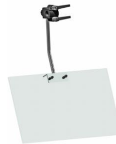
Flexibler Spritzschutz am Railingsystem montiert FSS-RS-500 Art. Nr. 069.300.248

KUGEL medical GmbH & Co. KG Hermann-Köhl-Str. 2a DE - 93049 Regensburg