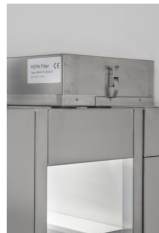
HEPA Filtersystem (nur für GrossPath GP-1500 verfügbar!) HEPA-GP-1500 Art. Nr. 060.260.070

KUGEL medical GmbH & Co. KG Hermann-Köhl-Str. 2a DE - 93049 Regensburg